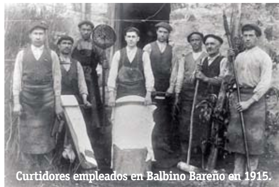
Curtidores empleados en Balbino Bareño en 1915.

Tampoco puede olvidarse que por esas fechas mejoraron las posibilidades de empleos para los jóvenes en la industria de transformación mecánica, mejor remunerados, que en las curtiderías. Asimismo las inversiones requeridas en las tenerías fueron crecientes al asumir nuestras empresas el proceso integral, mientras, por ejemplo, la opción catalana, sobre todo en Badalona, fue la especialización en cada una de las fases del curtido. ■