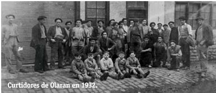
Curtidores de Olan en 1932.