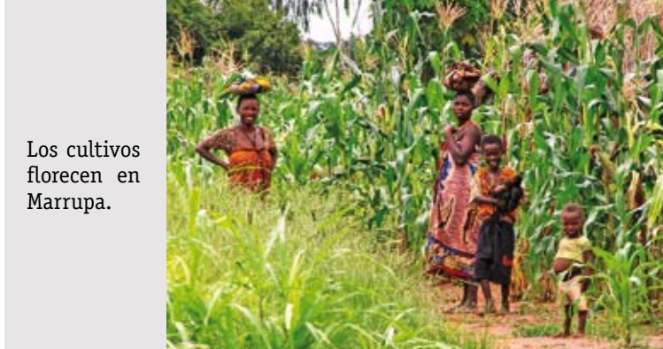
Los cultivos florecen en Marrupa.