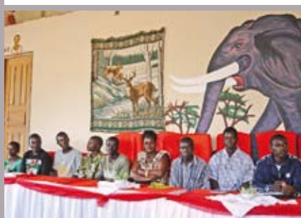
NEPAMAR agrupación de pequeñas empresas.