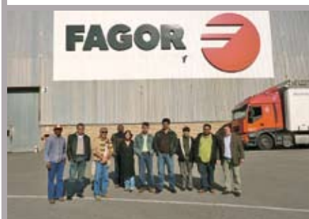
Participantes en Truke Programa visitan Fagor.