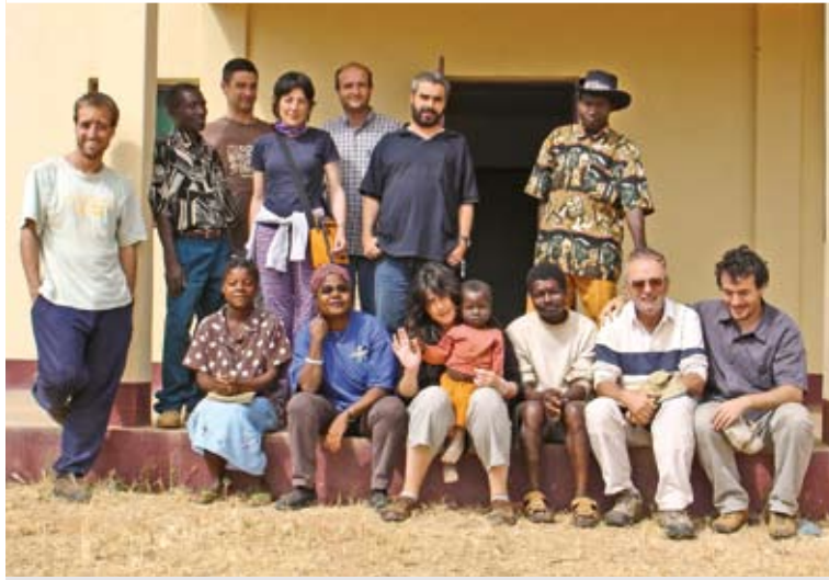
Equipo Marrupa. Reunión de la Comisión Mixta en Marrupa en 2005.

MUNDUKIDE eta MONDRAGONen arteko hitzarmena. El acuerdo de colaboración se firmó el 11 de junio de 1999 en el despacho del presidente del Consejo General (entonces ocupaba el cargo Antonio Cancelo).