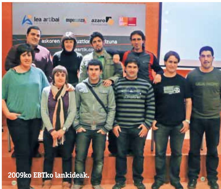
2009ko EBTko lankideak.

Egiten duten gutzia, beraz, enpresa munduari aplikatua