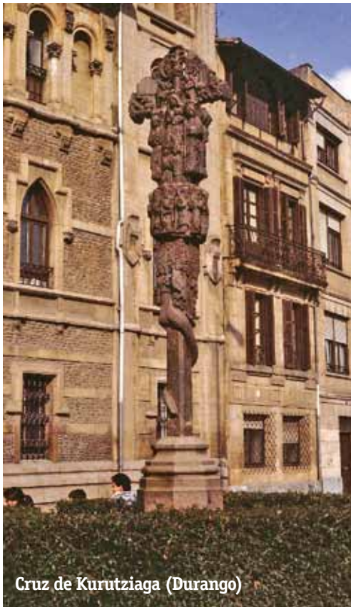
Cruz de Kurutzia (Durango)