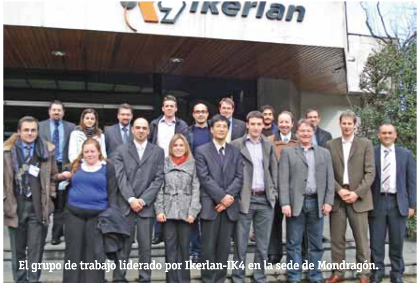
El grupo de trabajo liderado por Ikerlan-IK4 en la sede de Mondragón.

Este proyecto de investigación, que se llevará a cabo hasta mayo de 2012, cuenta con un presupuesto de 3,85 millones de euros, de los cuales 2,74 serán financiados con fondos comunitarios. El proyecto, liderado por el Grupo CIGIP de la