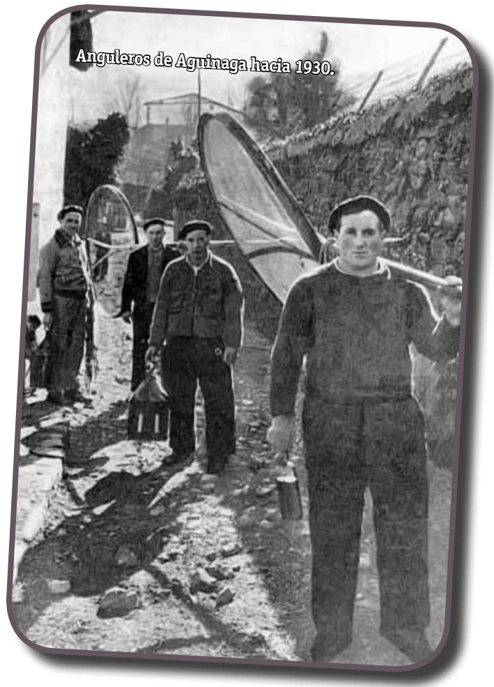
Anguleros de Aguinaga hacia 1930.

Antiguamente vestían con prendas impregnadas con aceite de linaza para que el agua resbalara sobre las mismas, y protegían su cabeza con una boina y un saco de arpillera. Un farol con dos velas o un candil de carburo era su sistema de alumbrado y generalmente pescaban en solitario, lo que agravaba el peligro del oficio, habiéndose algunos accidentes mortales. En la actualidad, los sistemas de pesca, así como la vestimenta y el alumbrado han evolucionado, pero el pescador sigue asumiendo riesgos.